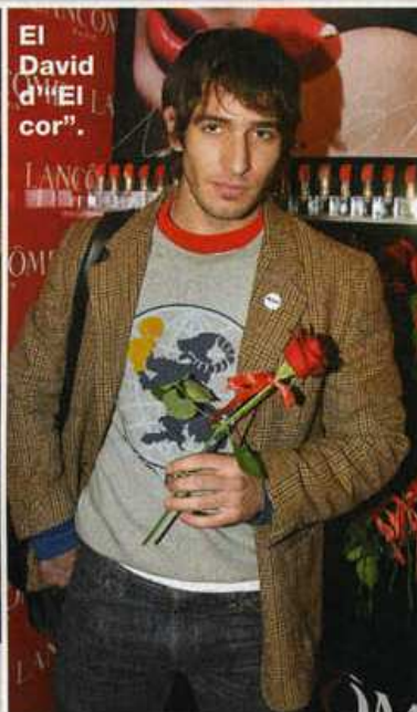
El David d'"El cor".