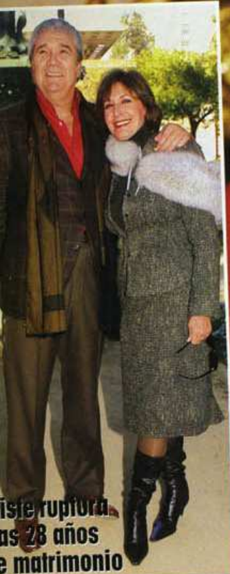
ruptura 28 años matrimonio

761 - 25 de Febrero de 2005 € - Canarias: 1,90 € (Only Spain)